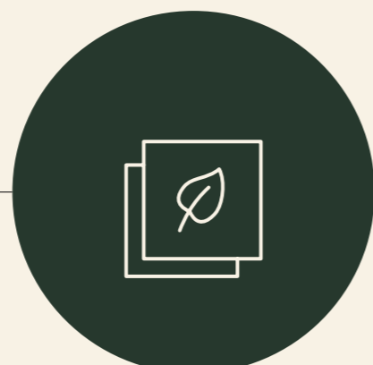
LES CRÉDITS CARBONE